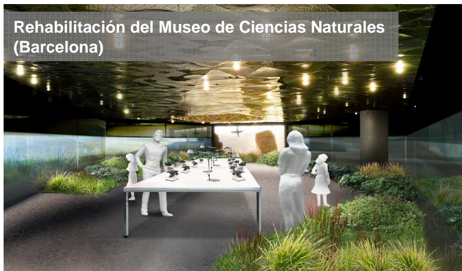
Rehabilitación del Museo de Ciencias Naturales (Barcelona)