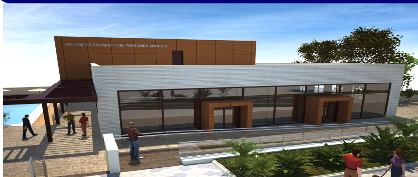
Centro de formación para adultos- L'Eliana (Valencia)