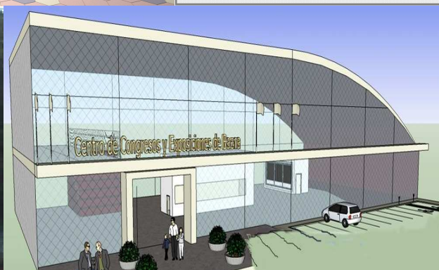
Baena (Córdoba) Centro de actividades empresariales