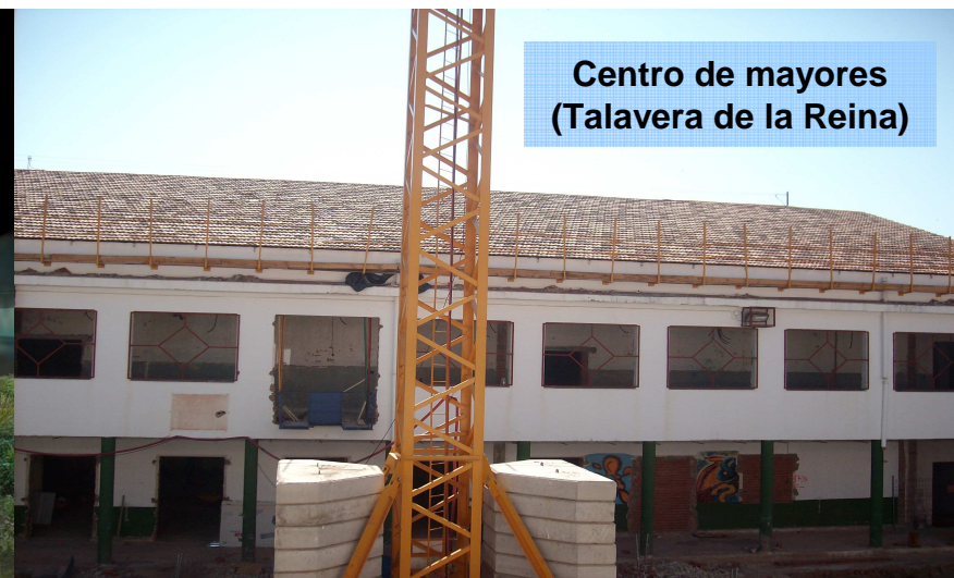
Centro de mayores (Talavera de la Reina)