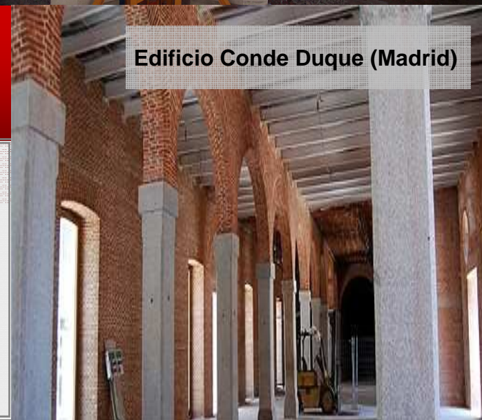
Edificio Conde Duque (Madrid)