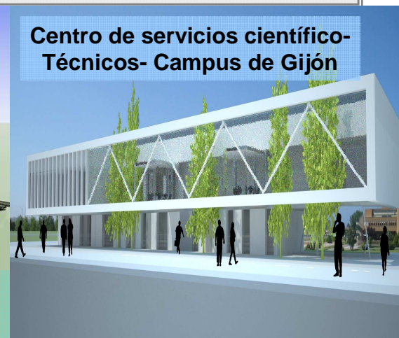
Centro de servicios científico-Técnicos- Campus de Gijón