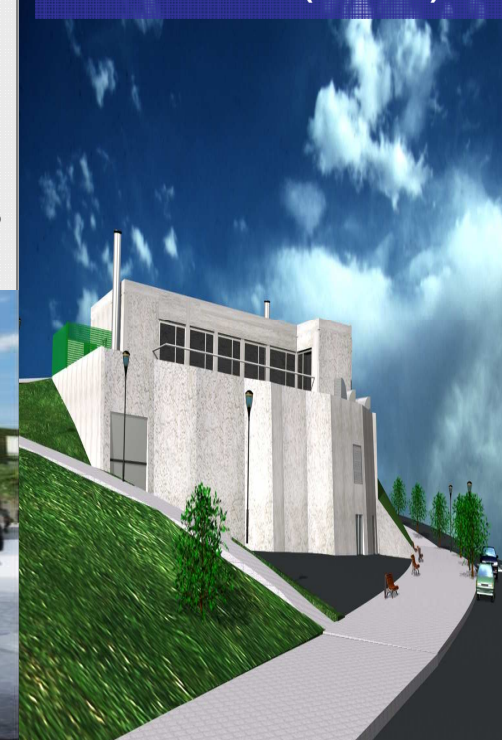
Centro de recogida automática de residuos (Basauri)