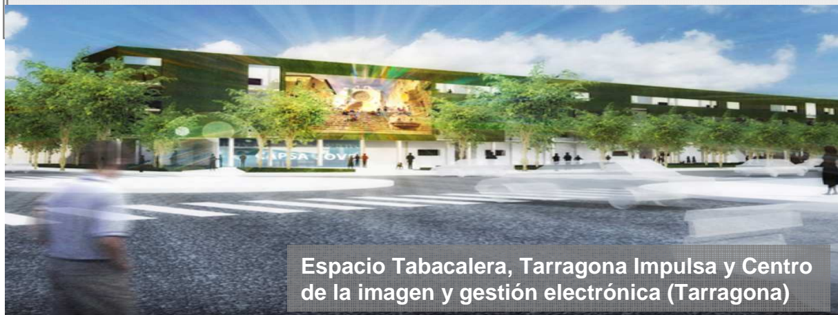
Espacio Tabacalera, Tarragona Impulsa y Centro de la imagen y gestión electrónica (Tarragona)