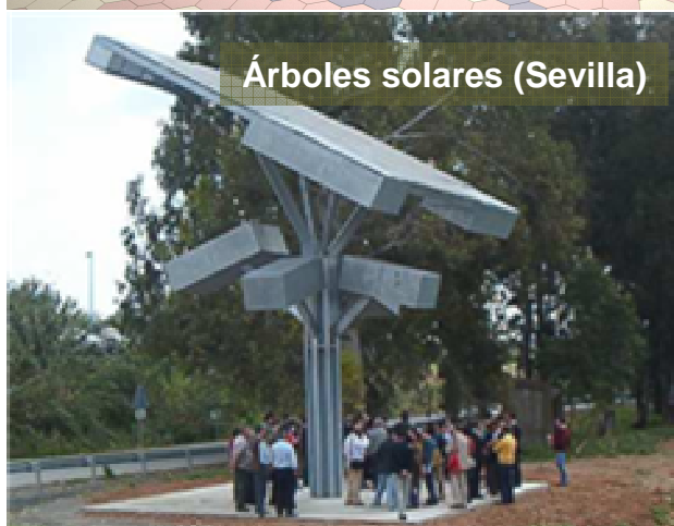
Árboles solares (Sevilla)